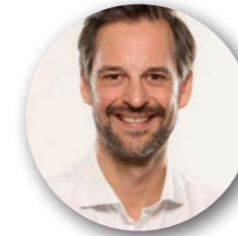
Ihre Fragen ...

„Das zutiefst Menschliche in uns zu entdecken, wird unsere wichtigste Aufgabe im 21. Jahrhundert.“