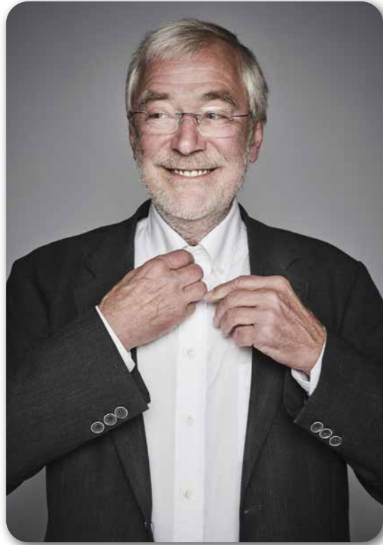
Prof. Gerald Hüther

Prof. Gerald Hüther, Dr. rer. nat. Dr. med. habil., Neurobiologe, Vorstand der Akademie für Potentialentfaltung, Biologiestudium, Forschungsstudium und Promotion an der Universität Leipzig, Habilitation an der Medizinischen Fakultät der Universität Göttingen.