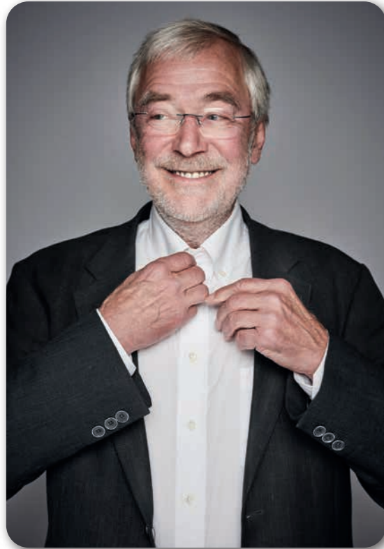
Prof. Gerald Hüther

„Das zutiefst Menschliche in uns zu entdecken, wird unsere wichtigste Aufgabe im 21. Jahrhundert.“