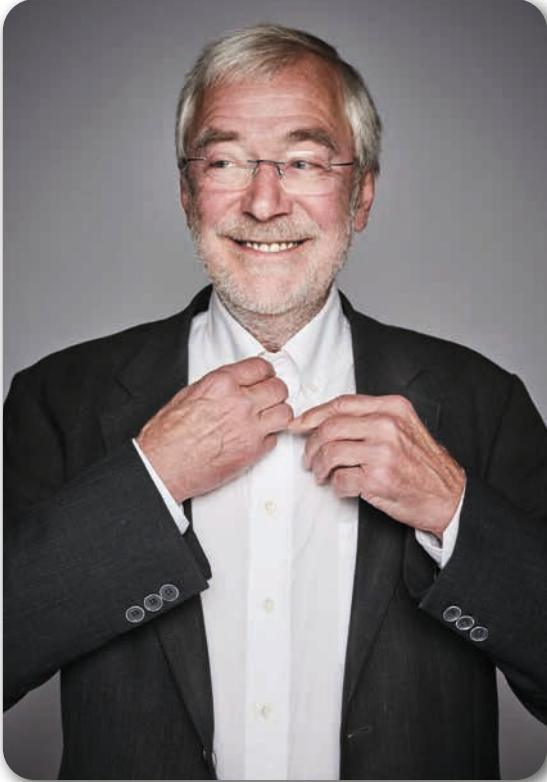
Prof. Gerald Hüther

Prof. Gerald Hüther, Dr. rer. nat. Dr. med. habil., Neurobiologe, Vorstand der Akademie für Potentialentfaltung, Biologiestudium, Forschungsstudium und Promotion an der Universität Leipzig, Habilitation an der Medizinischen Fakultät der Universität Göttingen.